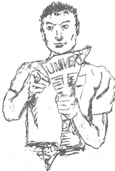
Grafik Tobias Fernández Gonzalo

Redaktionelle Arbeit macht dir Spaß? Fotografieren ist deine Leidenschaft? Marketing, Werbung oder Controlling sind dein Fachgebiet? Das Internet ist dein Zuhause und du pflegst gerne Websites?